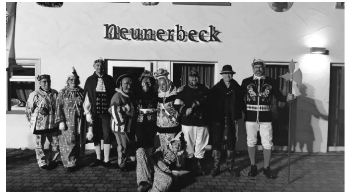
Das Team „Maskenabstauben“ - alle Teilnehmer wurden vorab getestet.

Euer Zunftrat der Narrenzunft „Henkerhaus“ Baienfurt e.V. 1936 (IR)