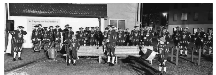
Vielen Dank an den Fanfarenzug, die Feuerwehr und an die Gemeinde für die gute Unterstützung!