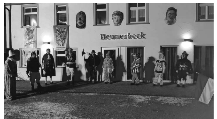
Schaut mal auf unsere Homepage, Instagram oder Facebook. Da gibt es einen kleinen Film zu sehen. Herzlichen Dank dafür an das „Filmteam Adler“.