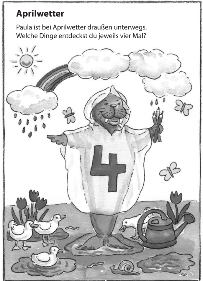
Lösung: Es gibt 4 Wolken, 4 Tulpen und 4 Pfützen. 752R10R3 © van Hoorn/DEIKE