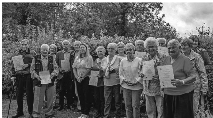
Die anwesenden Jubilare

Die Auflösung des Vereins kann nur in einer Mitgliederversammlung beschlossen werden, auf deren Tagesordnung die Vereinsauflösung den Mitgliedern angekündigt wird.