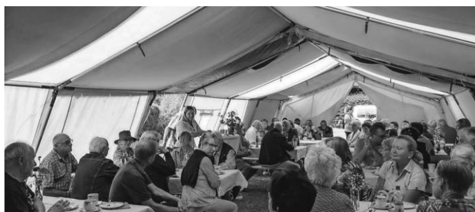
Das gut besuchte Festzelt