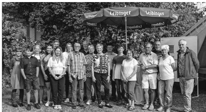
Die fleißigen Helfer