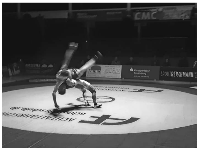
Kopfüber in die Saison

Die gegnerischen Mannschaften der II. Bundesliga: SRC Viernheim, RKG Reilingen-Hockenheim, VfK Schifferstadt, Wrestling Tigers Rhein-Nahe (Rheinland-Pfalz); KSV Rimbach (Hessen); RG Kurpfalz Löwen/Ladenburg-Schriesheim (Nordbaden); SV Siegfried Hallbergmoos (Oberbayern).