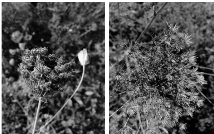
Hier verpuppt sich der Schwalbenschwanz Verblühte wilde Möhre in Ravensburger Blühstreifen

info@lev-ravensburg.de oder jasmin.salomon@lev-ravensburg.de