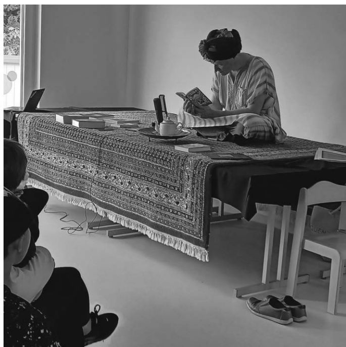
Das Regenwetter machte uns gar nichts aus - wir holten den Märchenzähler einfach rein...

Es ist also viel los im Kindergarten und im Kinder- und Familienzentrum. Schaut doch einfach mal vorbei - Abwechslung und Unterhaltung, Begegnung und Erlebnisse sind garantiert.