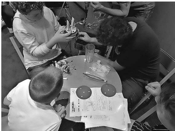
„Das Modell zu bauen, hat richtig viel Spaß gemacht!“

dukt und Maschine durch RFID Chips miteinander „reden“. An Station fünf lernten die Schülerinnen und Schüler in einer VR-Anwendung, wie moderne Intralogistik funktioniert.