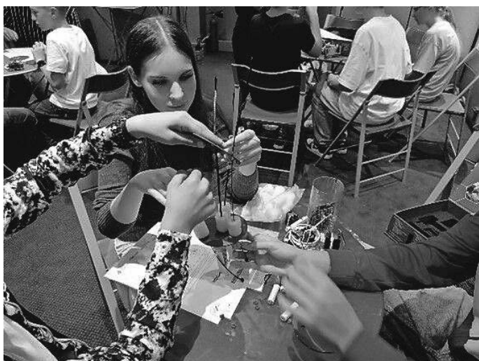
„Es war nicht ganz so leicht wie gedacht, aber interessant!“