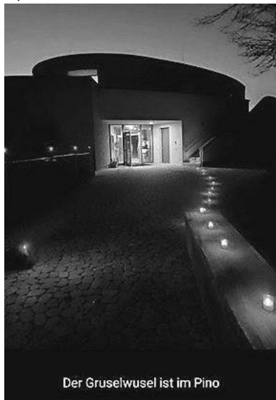
Der Gruselwusel ist im Pino

Wie gut passte es da, dass exakt an diesem Nachmittag die traditionelle Apfelsaftspende der „Freien Wähler“ übergeben und auch sogleich verkostet wurde. An dieser Stelle von Kindern und pädagogischen Fachkräften des Kindergartens und des KiFaZ ein ganz herzliches DANKE SCHÖN für den leckeren Apfelsaft!!!!