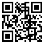
QR-Code für Spenden

Neben der Kollekte am 1. Advent können Spenden auch direkt auf das Konto des GAW überiesen werden. Evangelische Bank eG, IBAN: DE92 5206 0410 0003 6944 37 Weitere Informationen unter www.gaw-wue.de und in den Sozialen Medien unter @gaw_vernetzt.