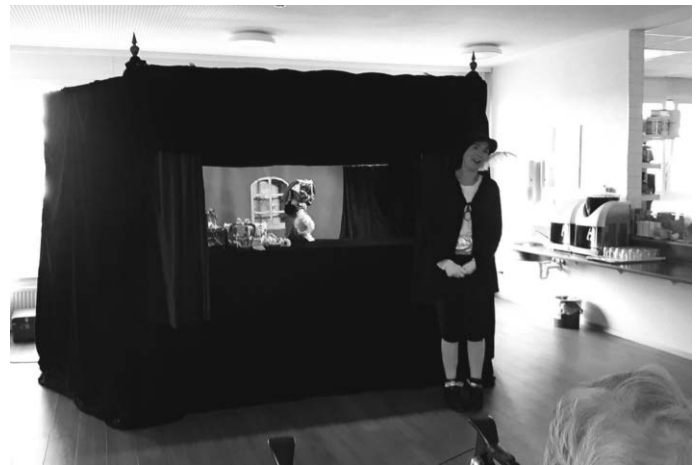
Die Ostracher Puppenbühne