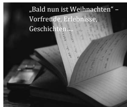
„Bald nun ist Weihnachten“ – Vorfreude, Erlebnisse, Geschichten...

Wir beginnen - wenn nichts anderes angegeben ist - um 8.30 Uhr, Ende gegen 11.30 Uhr. Der Kostenbeitrag beträgt in der Regel 5,50 €; Material nach Verbrauch