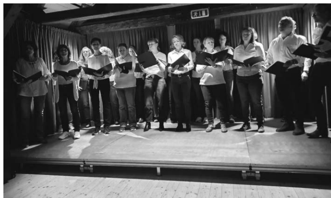
Die ChoriFeen im Einsatz